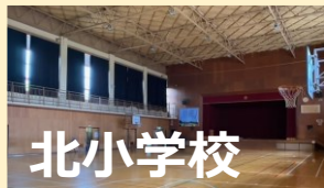
熊取町 希望が丘 4-14-4

本取組を通して、以下の小学校において、 障害者でも安心・安全な環境づくり を進めていきます。